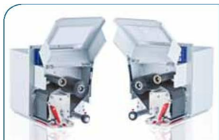
Modelos a la derecha y a la izquierda

Los módulos de impresión desarrollados para aplicaciones de alta velocidad con un alta carga de etiquetas son especialmente apropiadas para los sistemas de impresión y aplicación, como p.ej. clasificadoras de cartas, etiquetado de palés y marcado de componentes electrónicos. Al desarrollar este etiquetador se prestó especial atención a que tanto la carcasa como el mecanismo de impresión se fabricaran con materiales de alta calidad, con lo que se garantiza una alta fiabilidad, incluso bajo duras condiciones de uso.