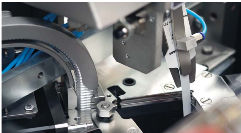
El cabezal Poly-clip System proporciona un cierre de clip fiable y un etiquetado a prueba de manipulaciones.